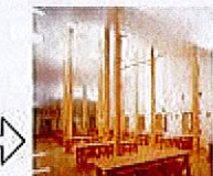
農業大学校学生寮 [現地説明者] 入江雅昭、 柴田真秀、西山英夫 *2001年日本建築学会賞 受賞(作品)