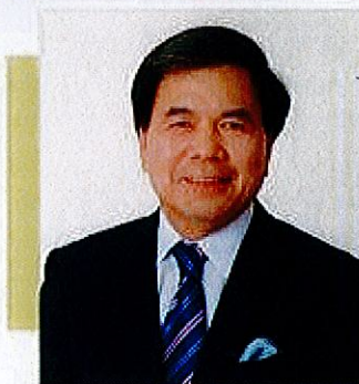
熊本県知事 蒲島 郁夫