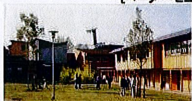
ゲルゼンキルヒュエンの総合学校