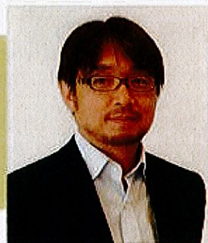
放送作家、脚本家 小山 薫堂