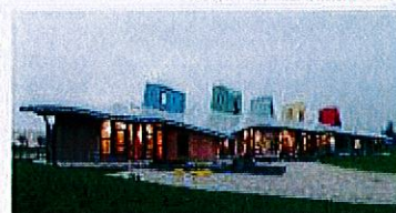
ブレーメンの幼稚園