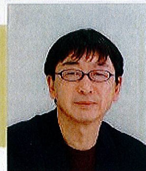
くまもとアートポリスコミッショナー 伊東 豊雄

<申込・問い合わせ先> くまもとアートポリス建築展2012実行委員会事務局(熊本県建築課内) TEL:096-333-2537 FAX:096-384-9820 E-mail:kenchiku@pref.kumamoto.lg.jp