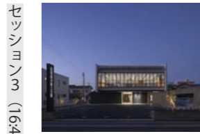
Kouji Okamoto (Techni Staff)