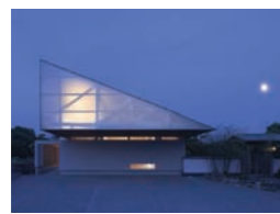
Kouji Okamoto (Techni Staff)